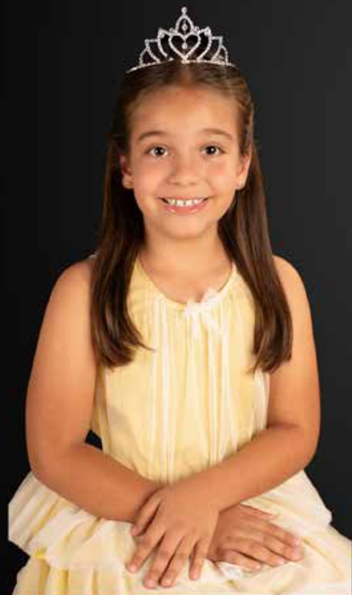
Reina Infantil 2022