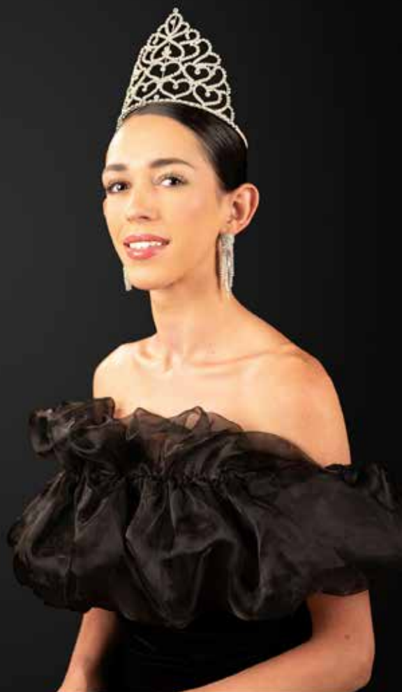
Reina Juvenil 2022