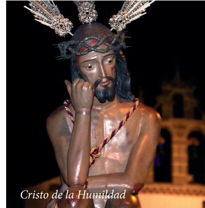
Cristo de la Humildad