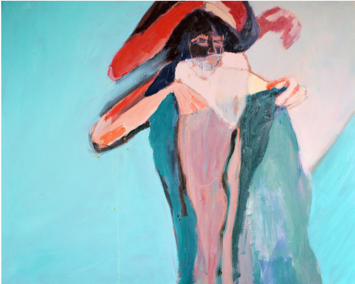
Elisa Pinto Retorcerse en bucle 65x81cm Óleo sobre lienzo