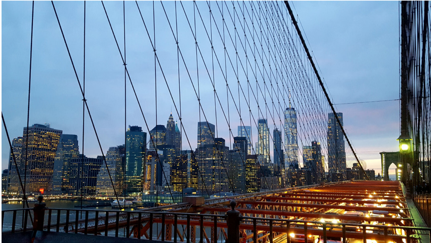
Maite Fernández González Momentos 45x30cm Fotografía