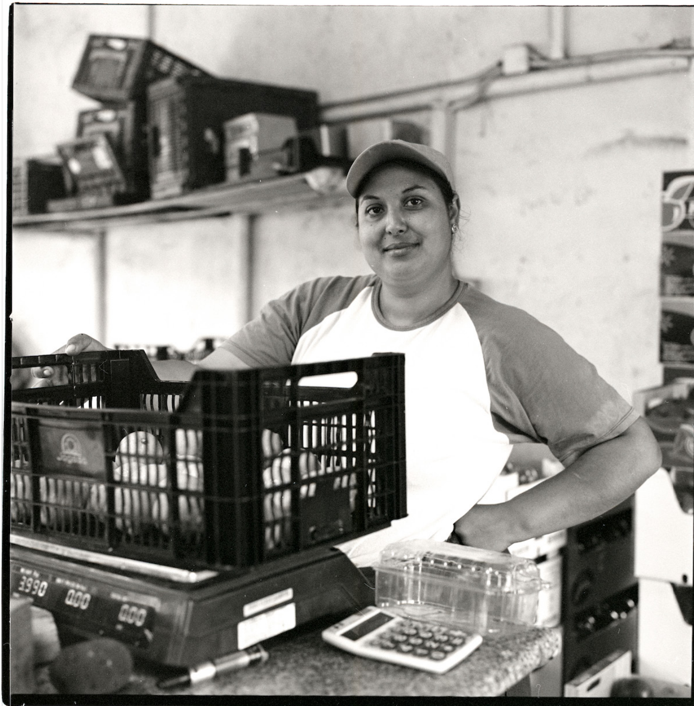
Izy Castro Felicia 100x100cm Fotografía blanco y negro, c-type