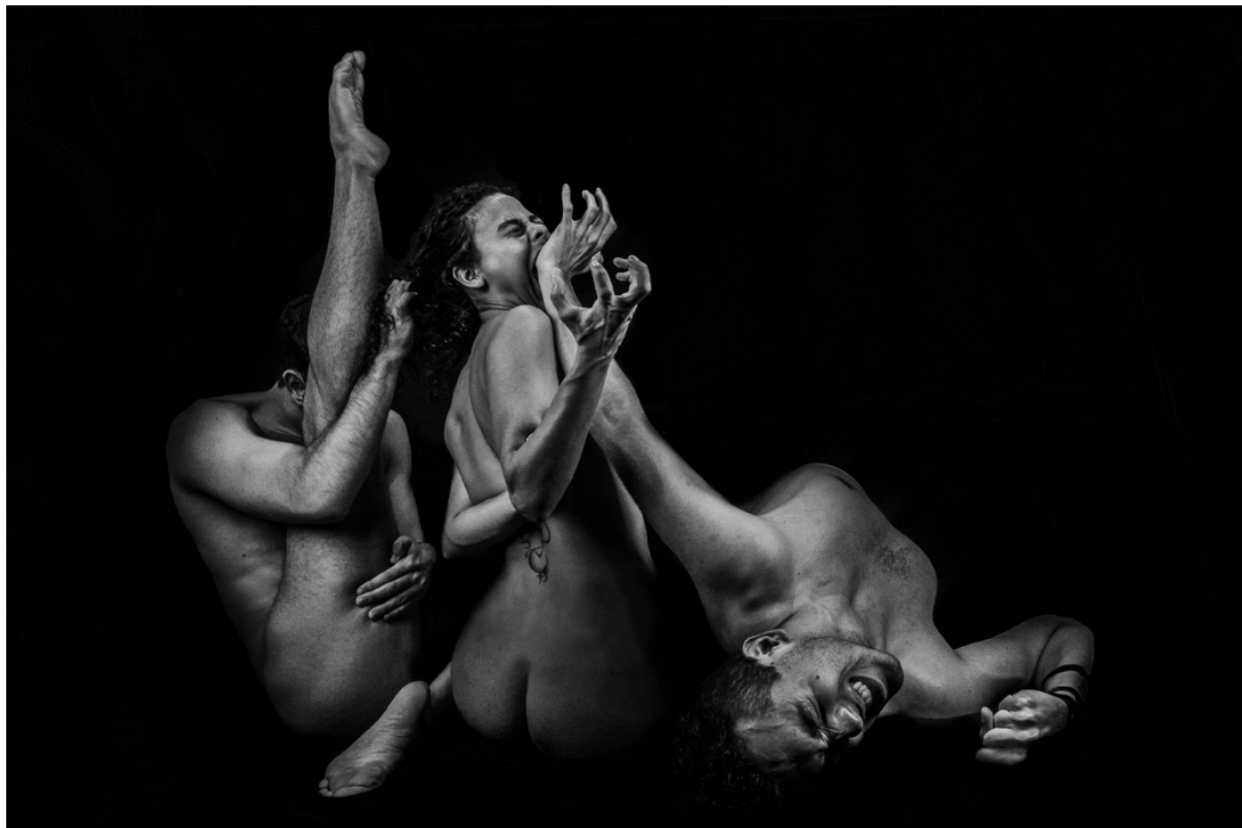
Tania Mª Hdez Ira 87x57cm Fotografía digital