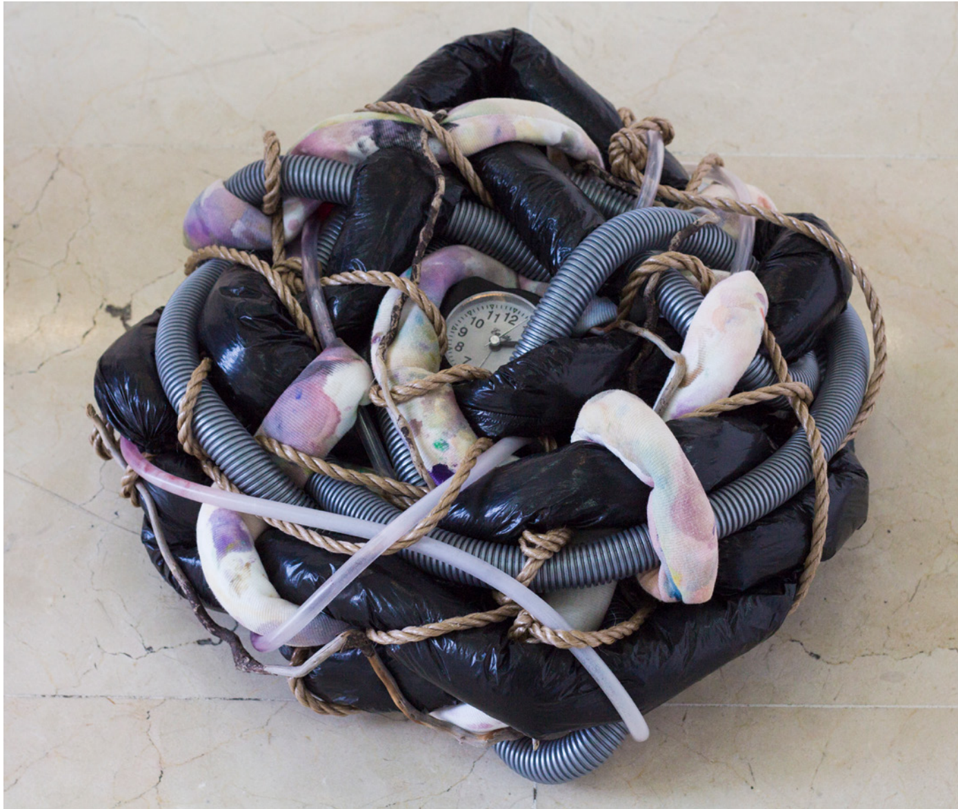
Boryana Korcheva Insomnio 60x60x30cm Tela, cuerda, plástico, madera, despertador