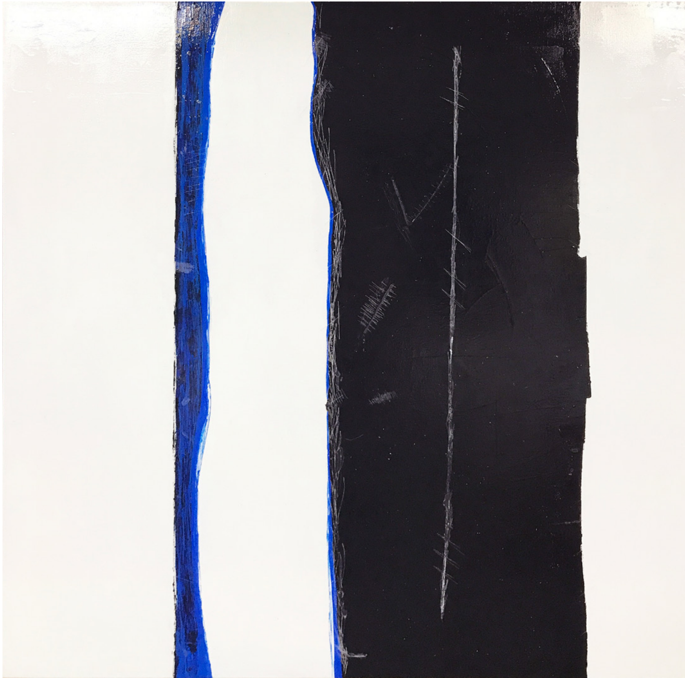
Ibele Lybaert Cicatrices 100x100cm Acrílico sobre lienzo