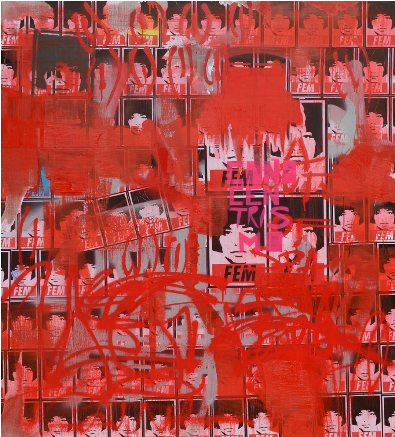
Lis Es Beth Negra I 120x120cm Técnicas mixtas sobre tabla entelada