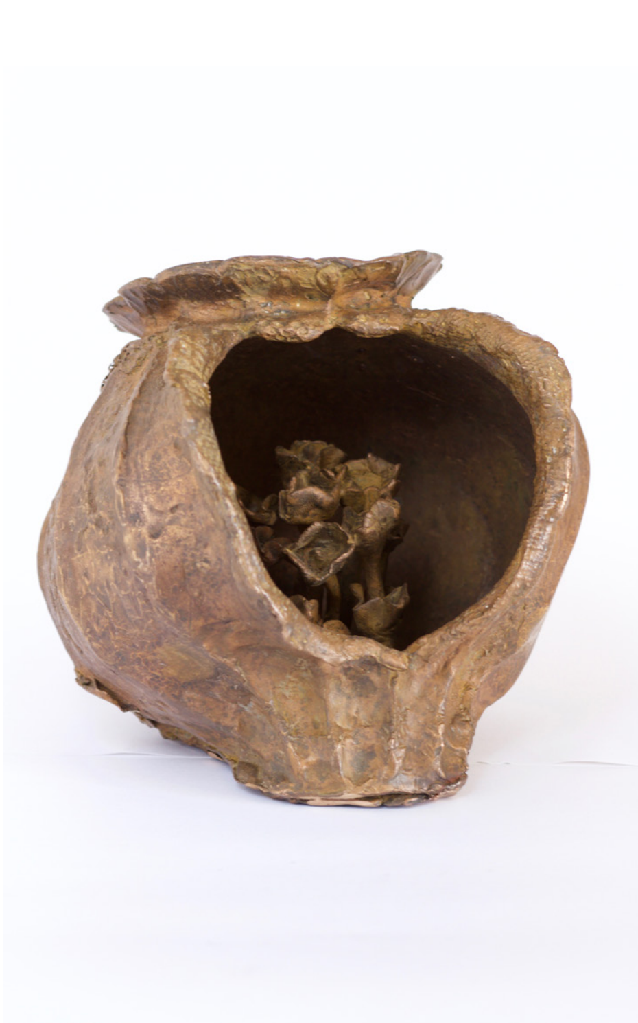
Dayari Felipe Simón Australia II 20x20cm Bronce y latón