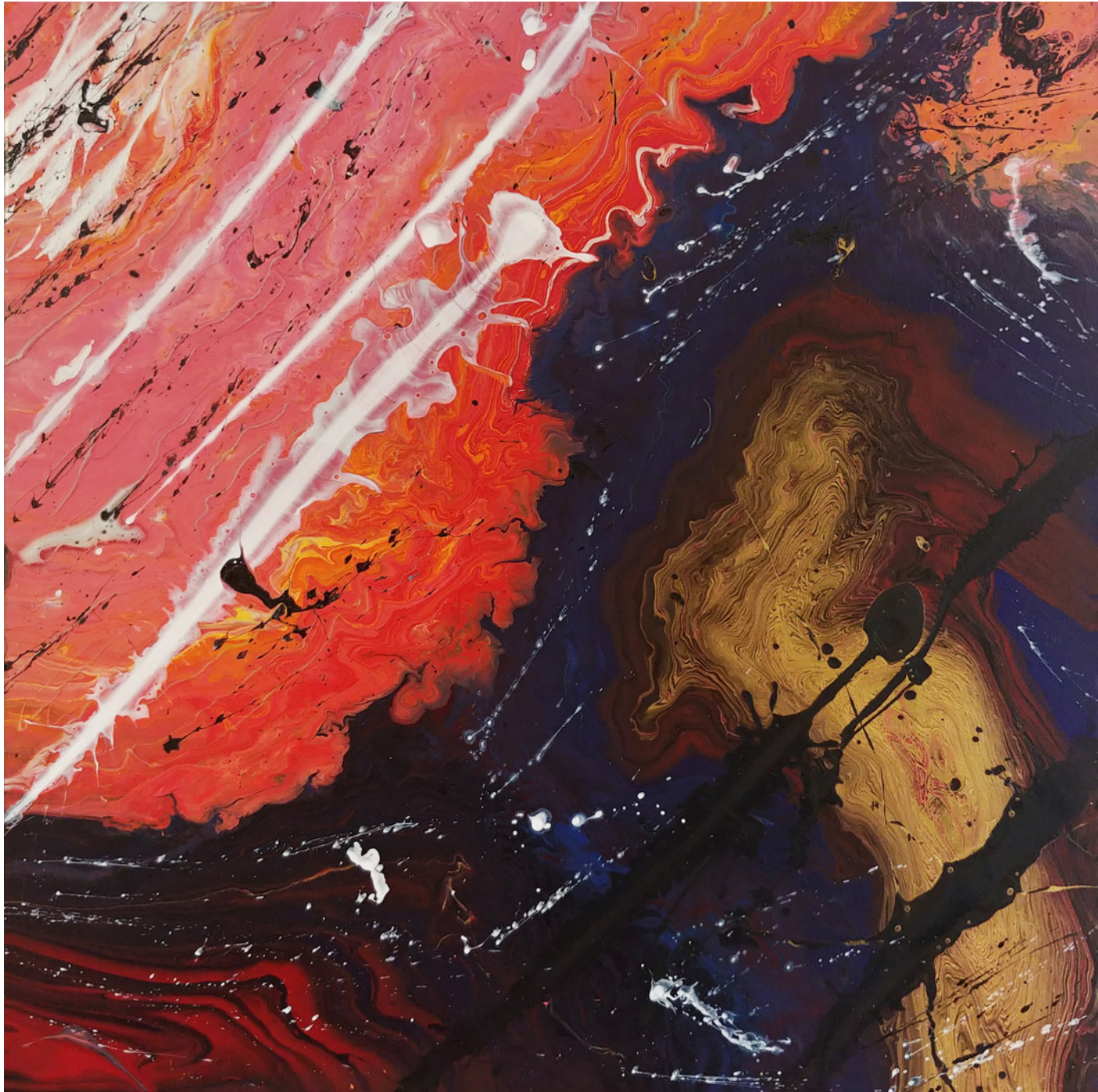
Lana Khoziainova Betrayal 50×50cm Acrílico sobre lienzo