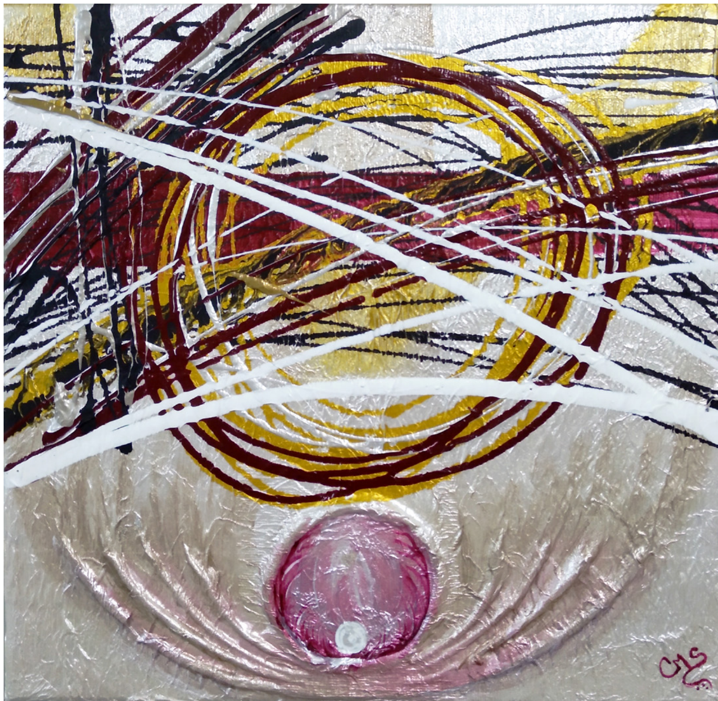
ChrisMS Pensamiento de Venus 30x30cm Acrílico, gouache y modelado de terracota