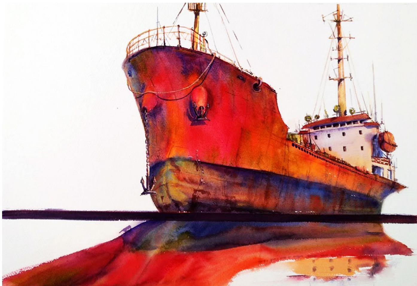
Volha Belevets Reflejo 50x70cm Acuarela sobre papel