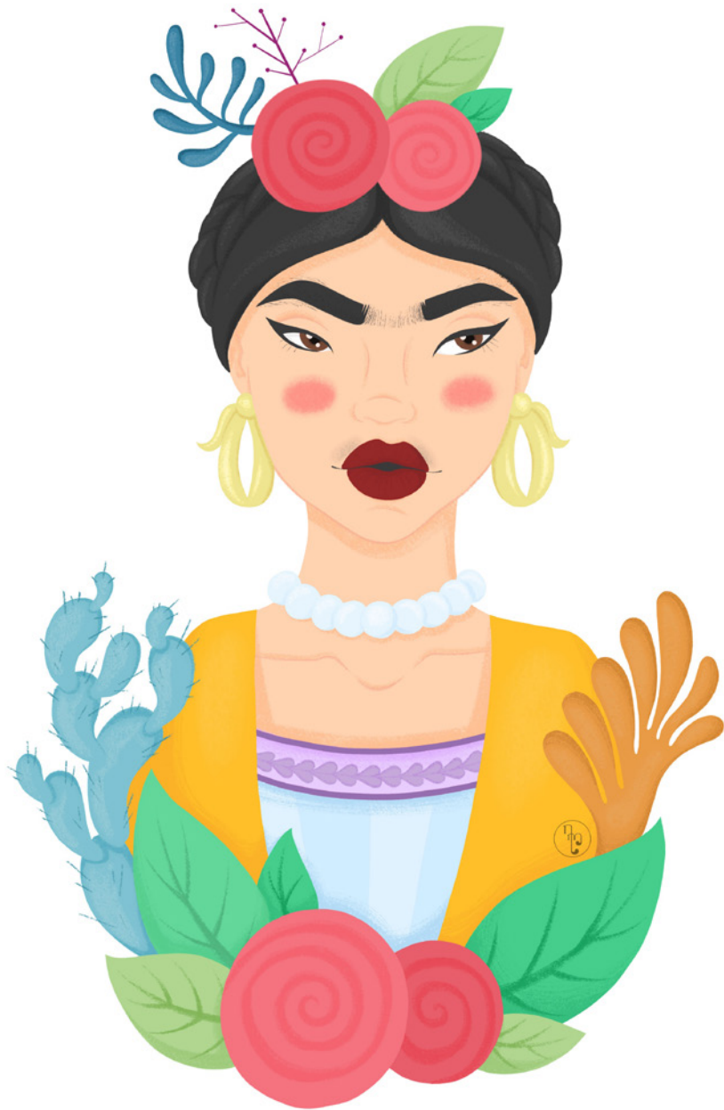
Némesis Mendoza Floral Kahlo 21x30cm Ilustración digital