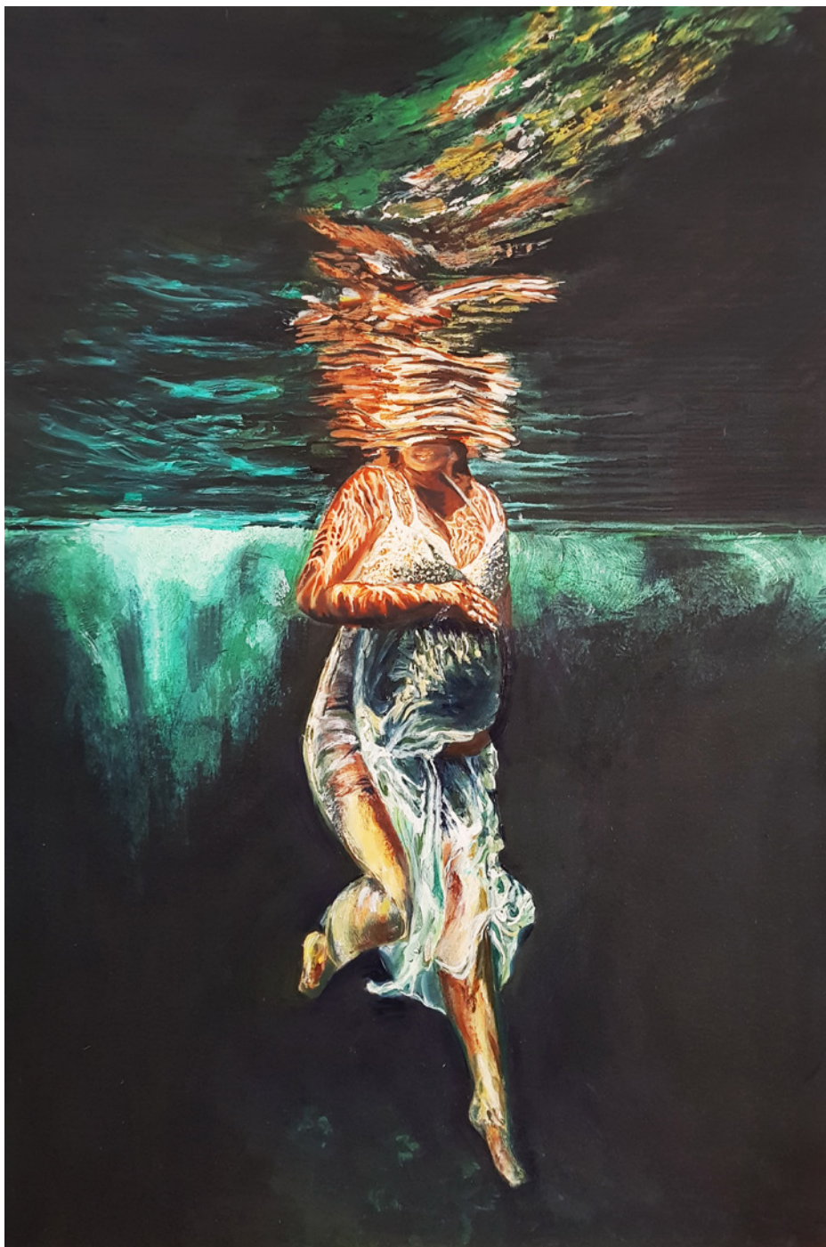
Beatrice Violleau Bajo el agua 120x80cm Óleo sobre lienzo