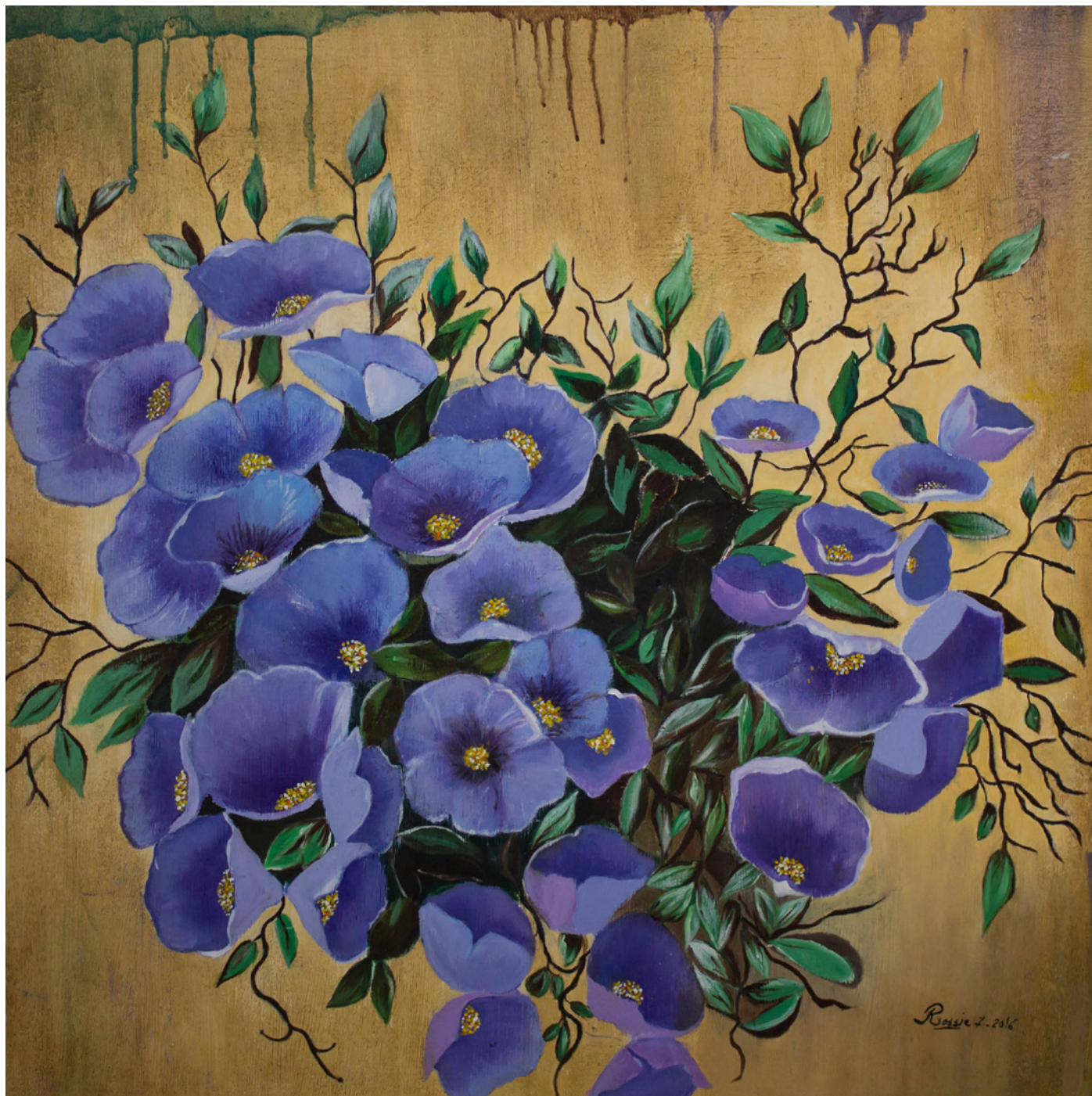
Rossie Guerrero Martínez Pensamientos 60x60cm Óleo