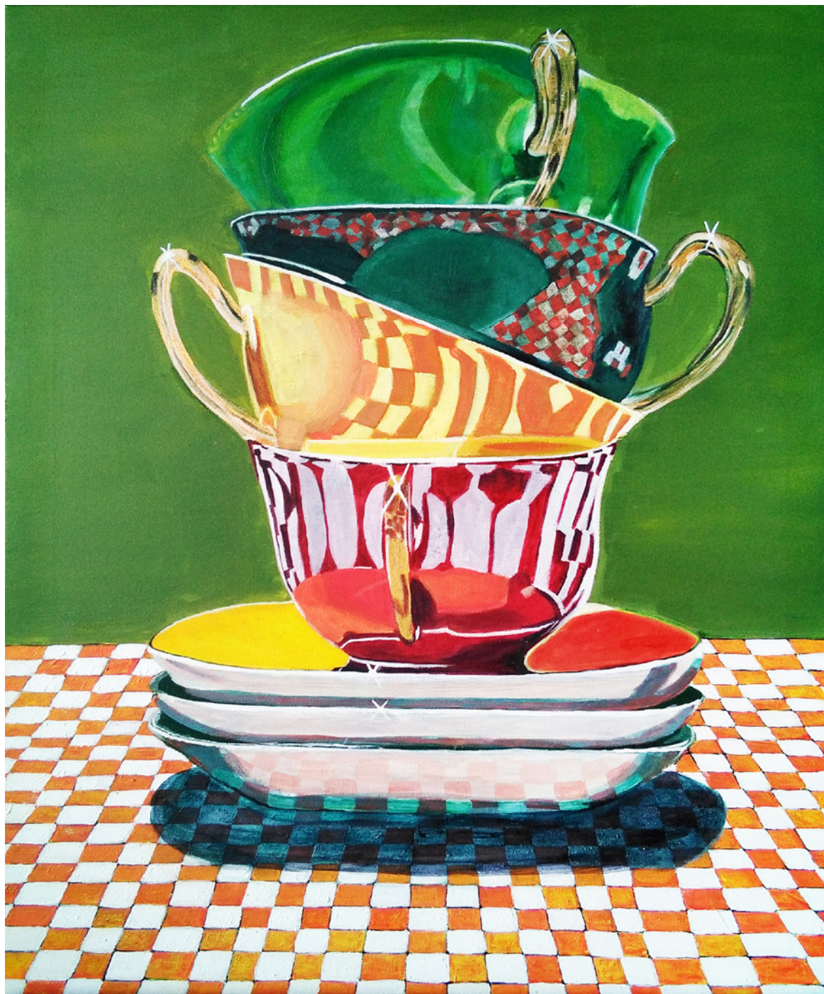
Cande Alonso Equilibrio 60x50cm Acrílico sobre lienzo