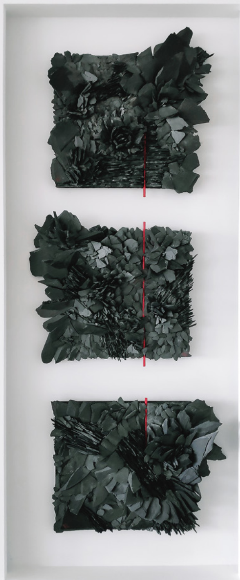
VBi Tríptico floral 110x30cm Collage de piedras pizarra