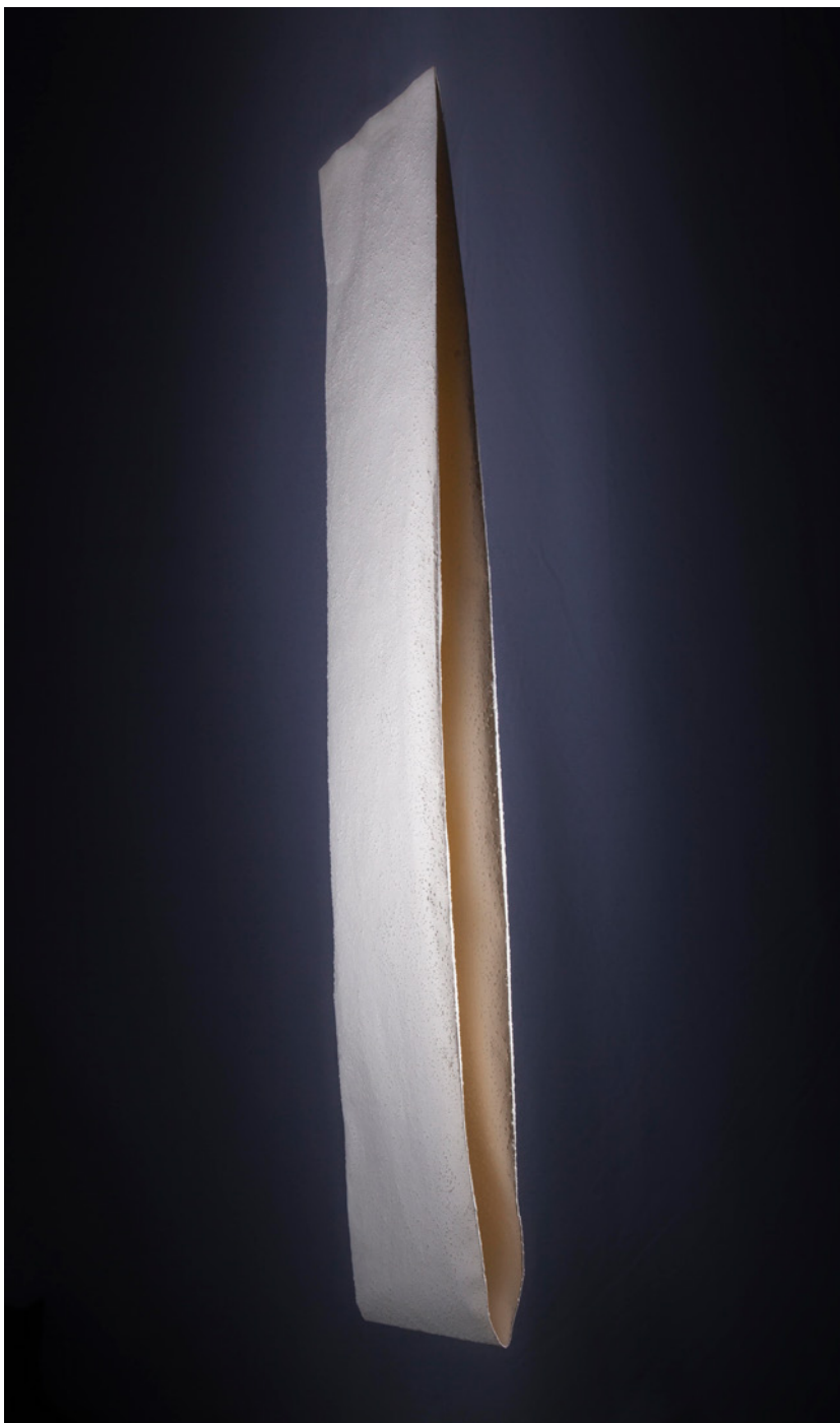
Ohiane de Felipe Balanus 115x25,5x8cm Escultura de papel