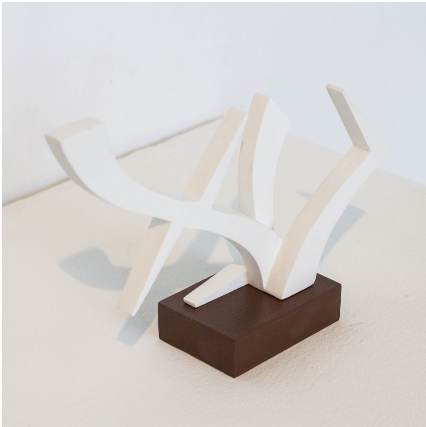
Brenda Talos 30x15cm Escayola