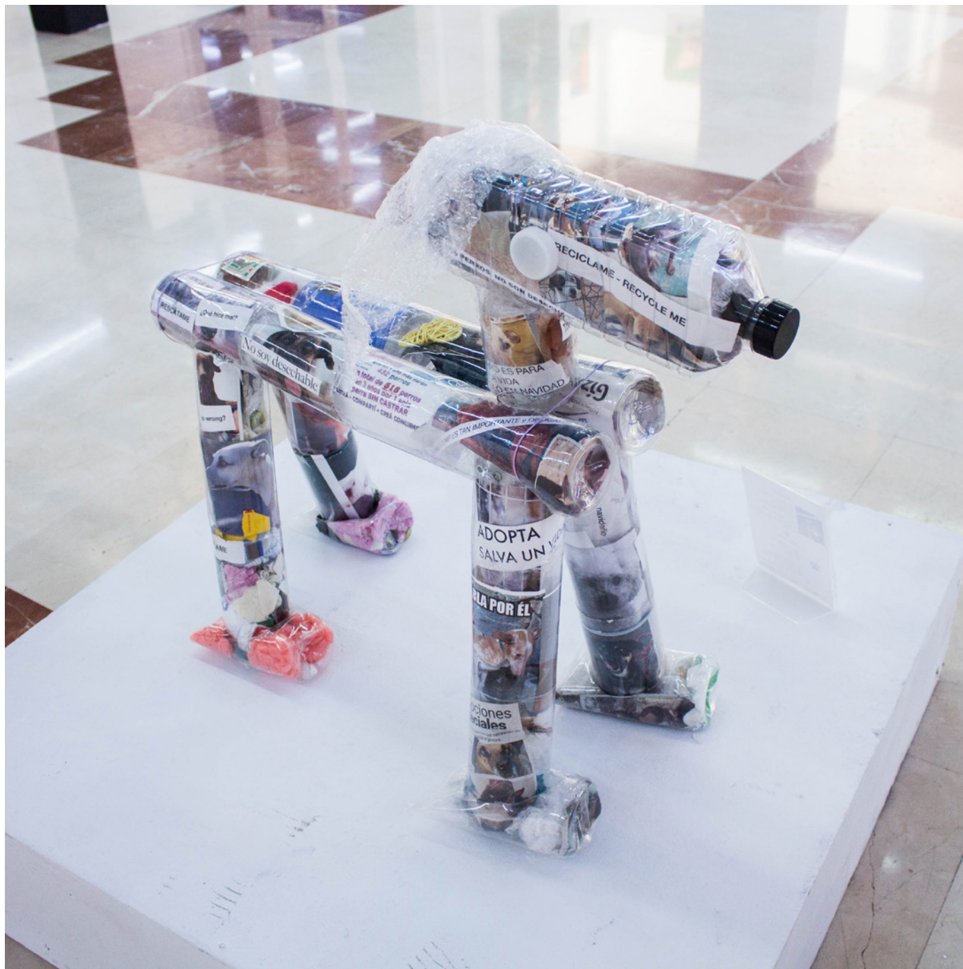
Nikki Attree ¡Recíclame! 66x75cmx38cm Botellas de plástico, fotografía y texto impreso