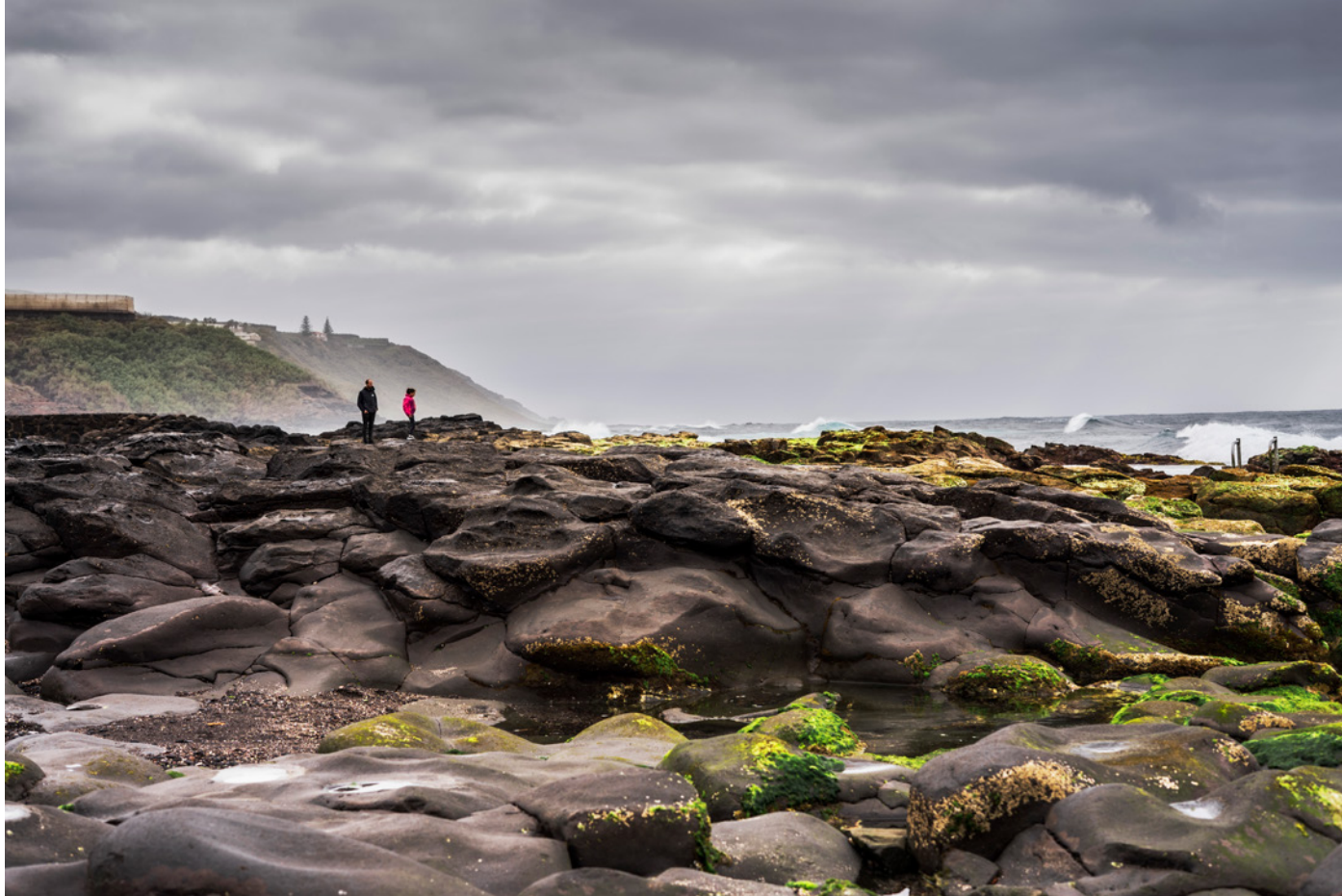
Raquel García Día de tormenta, dulce compañía 35x40cm Fotografía digital