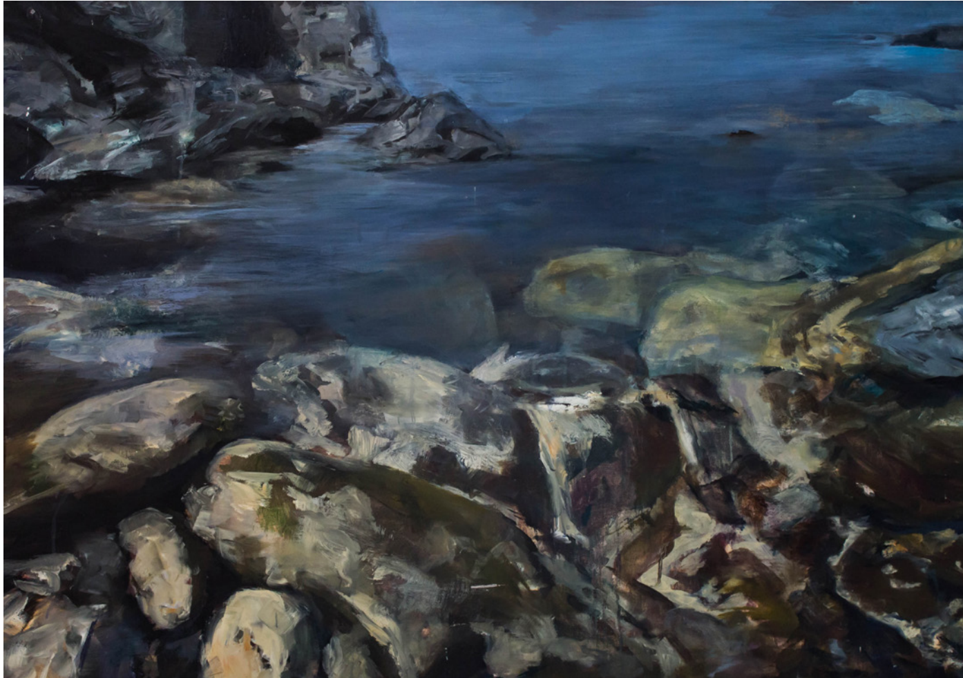
Carmen Gloria de Armas Pérez Desde el Faro de Punta Hidalgo 82x117cm Óleo sobre lienzo